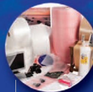
AirCap® Obaly s oddělenými bublinami