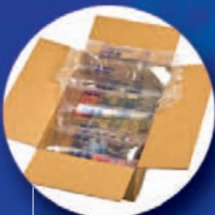
Fill-Air® Systém zabraňující otřesům vkládaný na místě