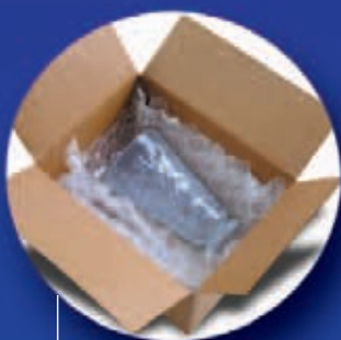
NewAir I.B.® Systém obalů