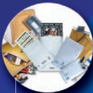
Mail Lite® Ochranné poštovní obaly