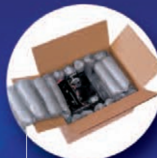
Instapak® Upevňená pěna