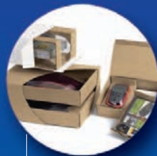
Korrvu® Závěsné obaly