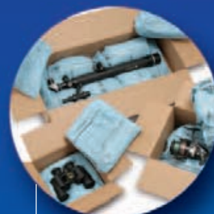
Instapak Quick® RT Upevňená pěna

Společnost Sealed Air má více než 30 obalových a vývojových center po celém světě. Přezkoumáváme a analyzujeme navrhované designy, vyvíjíme nové, testujeme existující obaly a doporučujeme nejlepší způsoby, jak maximalizovat ochranný účinek obalových materiálů společnosti Sealed Air.