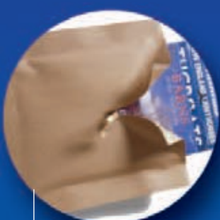
PriorityPak™ Automatizovaný systém obalů