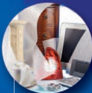
Cell-Aire® Polyetylenová pěna neobsahující CFC